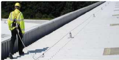
지붕 추락방지 시스템

→ 지원금액: 같은 사업주당 최대 3,000만원(당해년도 사업장별 1회 한함, 사업주는 약 10% 부담)