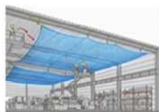
지붕 하부 추락방호망